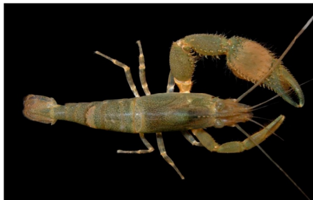
Figura 3. Macho adulto de Macrobrachium diguetti.