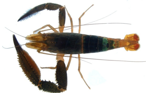
Figura 7. Macho adulto de Macrobrachium crenulatum.