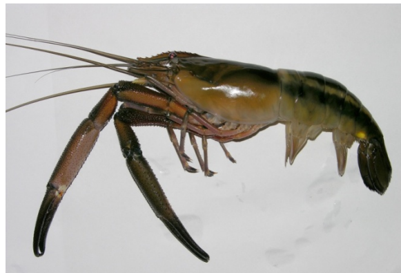
Figura 4. Macho adulto de Macrobrachium carcinus.