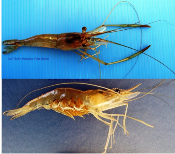
Figura 5. Superior, macho adulto de Macrobrachium amazonicum . Inferior, hembra ovígera.