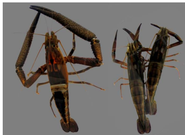
Figura 1. Macho adulto (izquierda) y hembras adultas (derecha) de Macrobrachium americanum .

en la costa del Pacífico mexicano, que también incluye este género. García-Guerrero et al. (2011) estudiaron el consumo de oxígeno de especímenes, siendo la temperatura el factor determinante en su consumo.