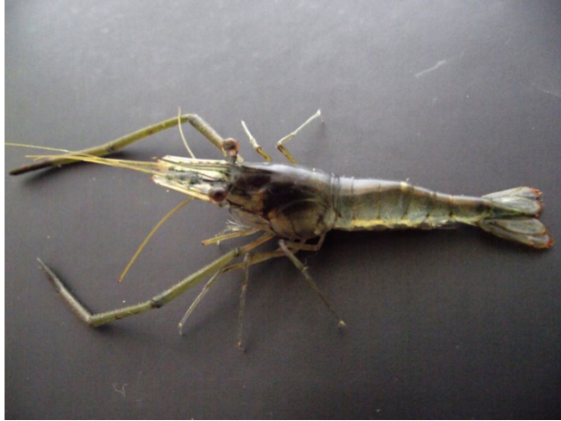
Figura 2. Macho adulto de Macrobrachium tenellum .