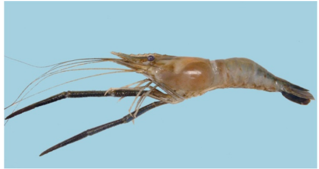
Figura 6. Macho adulto de Macrobrachium acanthurus (Foto de Luís Rólier Lara).

compartido con numerosos taxa de invertebrados, sobre todo crustáceos isópodos. Cunha & Oshiro (2010) analizaron el efecto de la ablación del pedúnculo ocular en la reproducción, encontrando que en los animales ablacionados los niveles de ecdysteroides incrementan rápidamente mientras que disminuyen en la intermuda. Recientemente, Tamburus et al. (2012) estudiaron aspectos poblacionales de la reproducción y en la costa noreste de Brasil.