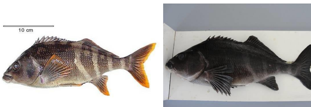
Figura 2. Cheilodactylus variegatus . Izquierda individuo con coloración normal, derecha ejemplar con melanosis.

rante medio (IV), con presencia de ovocitos formados, opacos y firmemente unidos por tejido ovárico. El tamaño medio de los ovocitos fue de 0,44 \pm 0,08 mm.