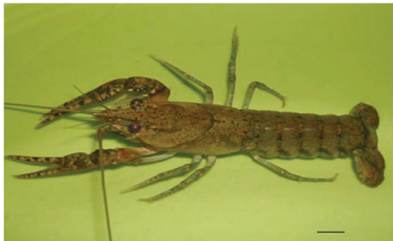
Figura 1. Samastacus spinifrons . Especimen en vista dorsal. Barra escala: 5,7 mm.